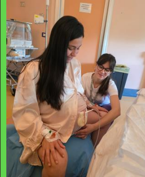
ASSISTENZA OSTETRICA ONE TO ONE DURANTE TRAVAGLIO, PARTO E PUERPERIO