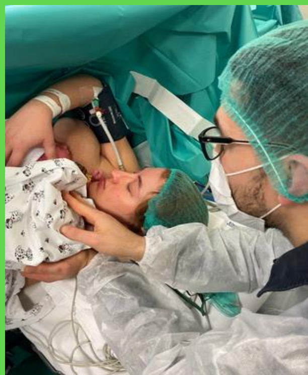
TAGLIO CESAREO "GENTILE" CON IL PAPÀ IN SALA OPERATORIA