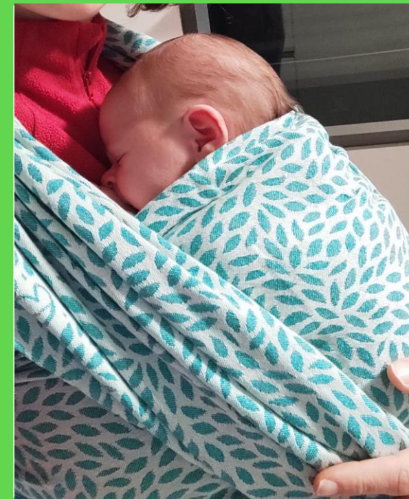
SUPPORTO BABY WEARING