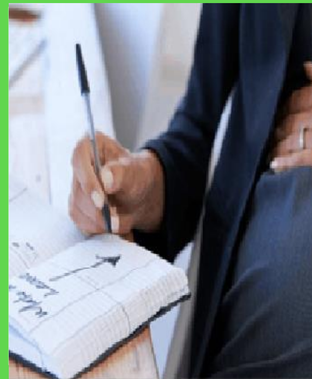
Percorso in gravidanza a basso e medio rischio, patologia della gravidanza e diagnosi prenatale.