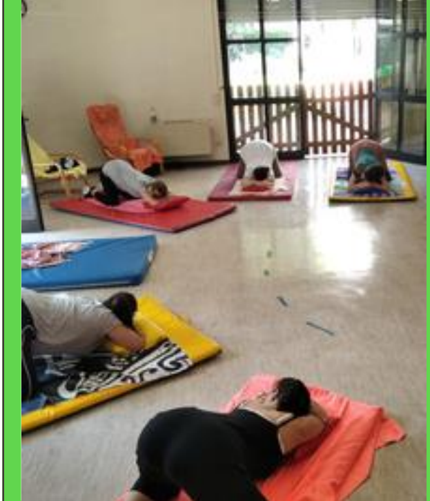
COLLEGAMENTO CON IL TERRITORIO PER UNA GRAVIDANZA E UN POST PARTO SERENI E CON VISITE DOMICILIARI