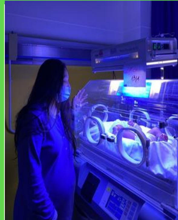
POSSIBILITÀ DI FOTOTERAPIA IN ROOMING-IN