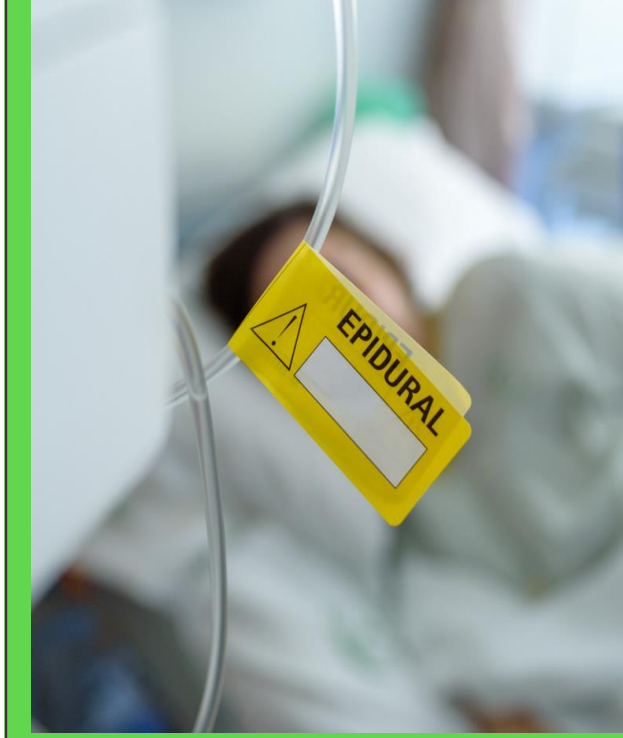
ANESTESISTA DISPONIBILE 24h/24