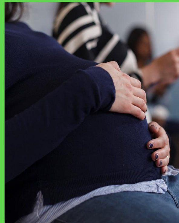
Procreazione medicalmente assistita (Presidio S.Paolo, blocco D, piano -1).