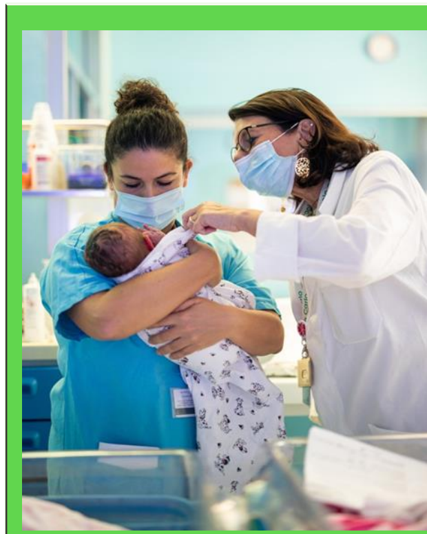
Le S.C. di Ostetricia e Ginecologia Presidio S.Paolo (blocco A, piano 0) Presidio S.Carlo (blocco B, piano 1).

L' ASST Santi Paolo e Carlo si impegna ad offrirti assistenza in tutte le fasi della vita, dall'infanzia, all'età fertile, gravidanza compresa, all'età pre e post menopausale. In molti ambiti, l'assistenza è di tipo multidisciplinare, in collaborazione con altre Strutture dell'Azienda.