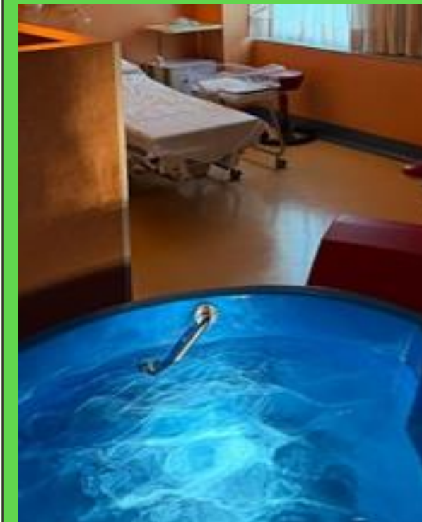
Metodi di contenimento del dolore non farmacologici: acqua, musica, aromaterapia..