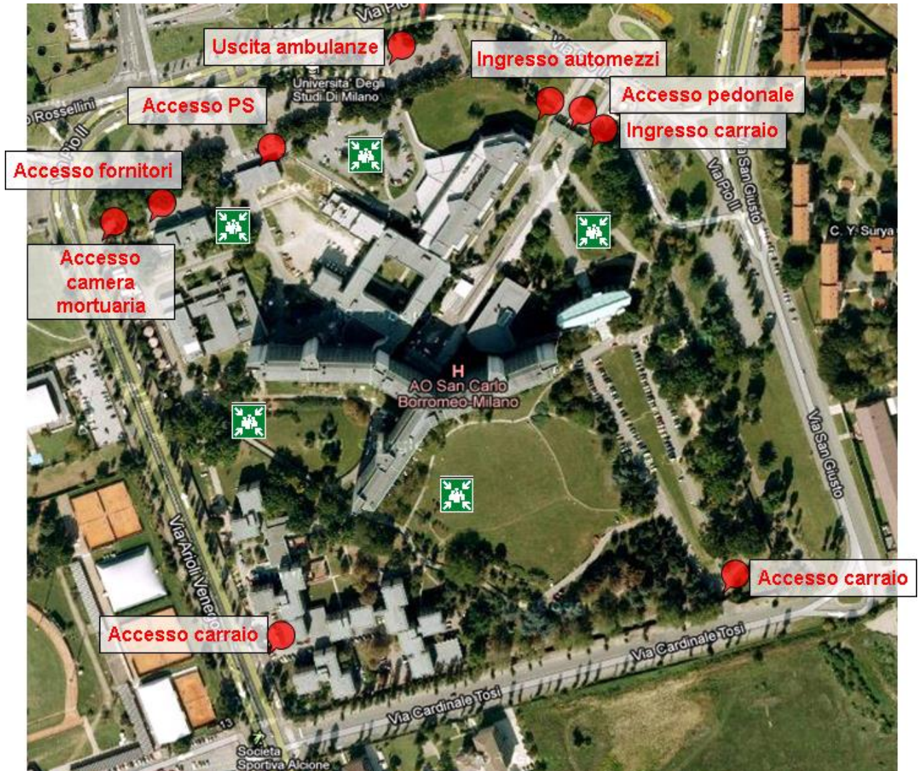
Figura 1 – Accessi dell'ospedale